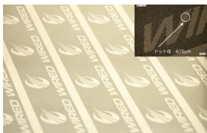
樹脂フィルムへの描画加工

ロールtoロールレーザー加工機は、単なる穴あけ加工だけに留まらず、専用ソフトによる、描画加工を実現しました。