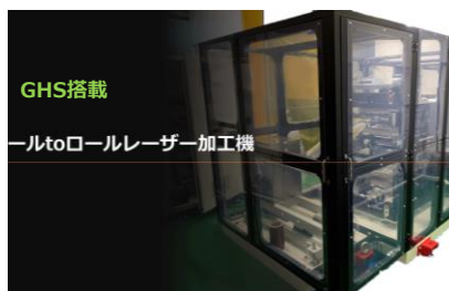
ロールtoロールレーザー加工機

ロールtoロールレーザー加工機は、単なる穴あけ加工だけに留まらず、専用ソフトによる、描画加工を実現しました。